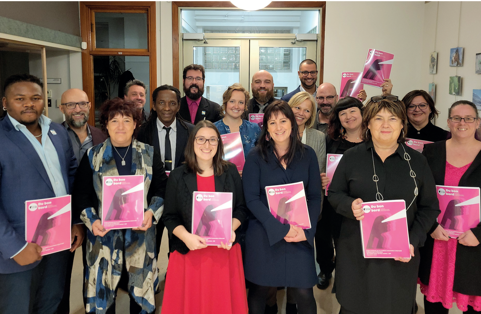
Les membres du comité de négociation de la FSSS-CSN avec le dépôt sectoriel.

Le Front commun a déposé ses revendications au gouvernement le 28 octobre dernier. Des centaines de travailleuses et de travailleurs étaient sur place pour montrer au gouvernement que nous sommes prêts à nous unir d'une seule voix pour gagner !