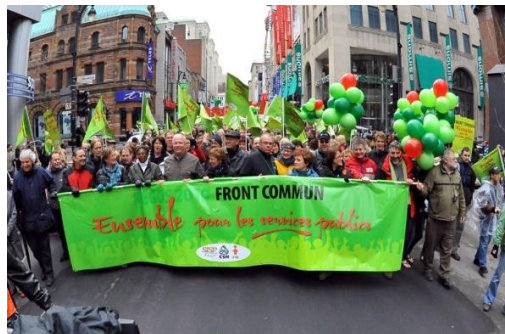
Manifestation du Front commun 20 mars 2010, Montréal

En 2010, le Front commun était formé, avec nous, de la FTQ, du SISP, de la FIQ (Fédération interprofessionnelle de la santé du Québec). Avec 470 000 travailleuses et travailleurs, il s'agissait du Front commun le plus imposant en nombre de l'histoire du syndicalisme du Québec.