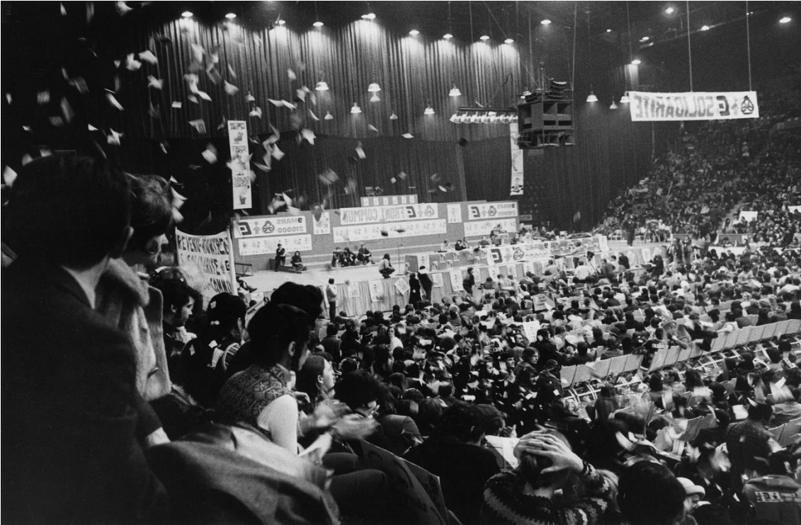
Rassemblement du Front commun au Forum de Montréal le 7 mars 1972. C'est lors de cet événement qu'aura lieu le vote ayant mené à la grève du 28 mars puis à la grève générale illimitée.