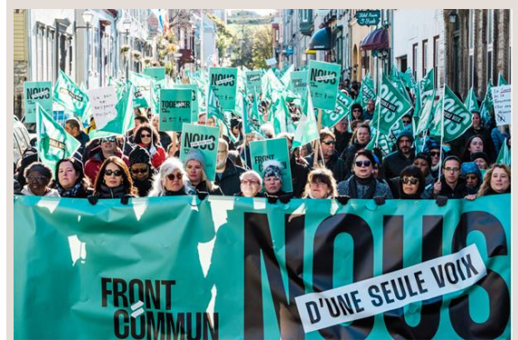
Manifestation du Front commun 30 mars 2023 Québec.

Le Front commun pour la ronde 2023 de négociations du secteur public a d'abord été formé par les trois grandes centrales syndicales, soit la Confédération des syndicats nationaux (CSN), la Centrale des syndicats du Québec (CSQ) et la Fédération des travailleuses et travailleurs du Québec (FTQ). Le Front commun a ensuite accueilli l'alliance du personnel professionnel et technique de la santé et des services sociaux (APTS).